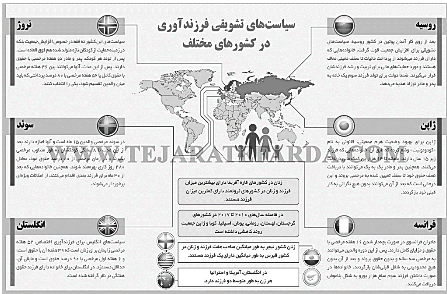
تصویر ۱. سیاست‌های تشویقی فرزندآوری در کشورها

«يَاهُمْ» (انعام، ۱۵۷) و «نَحْنُ نُرْزُقُهُمْ وَ اِيَّاكُمْ» (اسراء، ۳۱). این وعده و دلگرمی برای افرادی است که نسبت به این امر دچار نگرانی اند. پیامبر اکرم ﷺ فرمودند: «فرزند زیاد داشته باشید، تا فردای قیامت به زیادی شما افتخار کنم» (ابن شعبه حرانی، ۱۴۰۴ق، ص ۱۰۵). از دیدگاه آیت‌الله جوادی آملی، ذات اقدس الهی، همه را خلق و راه را باز کرده و فرمود: اگر کسی پایدار باشد، تمام روزی‌های او را تأمین می‌کنیم، «وَ اَنْ لَوْ اسْتَقَامُوا عَلَى الطَّرِيقَةِ لَأَسْقِينَهُمْ مَاءً غَدَقًا» (جن، ۱۶)، «اگر کسی اهل استقامت باشد، روزی‌اش را تأمین می‌کنیم؛ هیچ‌گاه درخت و بوته‌ای را تشنه نمی‌گذاریم» («مَنْ أَصْدَقُ مِنَ اللَّهِ قِيلًا» (نساء، ۱۲۲)، «از خدا راستگوتر کیست؟» (جوادی آملی، ۱۳۹۷/۰۴/۰۷). تشویق به فرزندآوری از عوامل توسعه کشورها محسوب می‌شود، کما اینکه این رویکرد در برخی کشورها چون روسیه، نروژ، ژاپن، سوئد، فرانسه، انگلیس نیز قابل ملاحظه است.